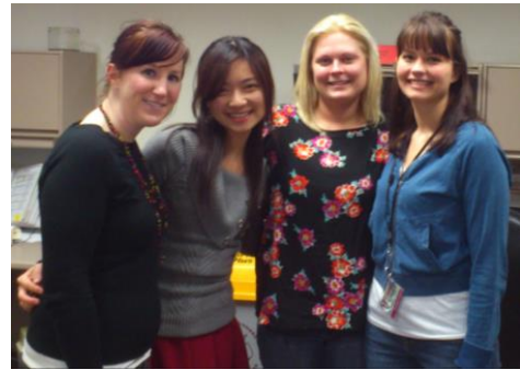
Program in Human Sexuality 可愛的同事們☺

Clients 包含 Sexual offenders(強姦犯, 戀童癖,偷窺暴露狂...)、 Transgender(男變女&女變男)、 Compulsive sexual behavior patients(強迫性行為,無法克制的一直網路交友外