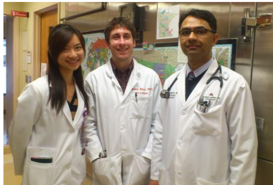
Hema/Onc consult team

美國各個內科專科主治醫師工作內容都很截然地分成 Outpatient doctor and Inpatient doctor，而 Consult team 的 attending 都是 Outpatient doctor，