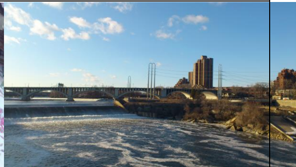
我的慢跑路線之一——橫跨密西西比河