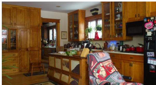
租屋處與房東共用的溫馨廚房

在 twin city grocery shopping, 一點都不是問題，Twin city 指 St. Paul & Minneapolis