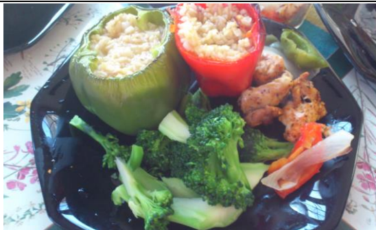
自己下廚之甜椒烤肉燉飯