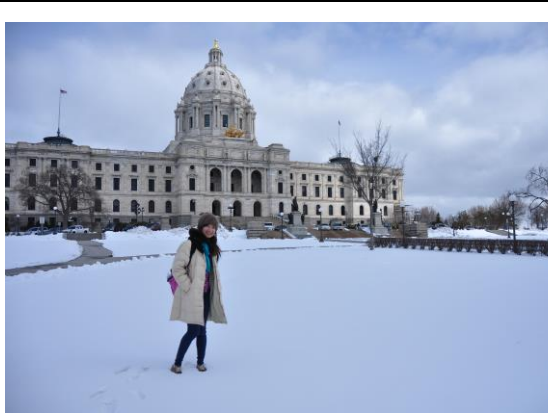
Minnesota capital- St. Paul