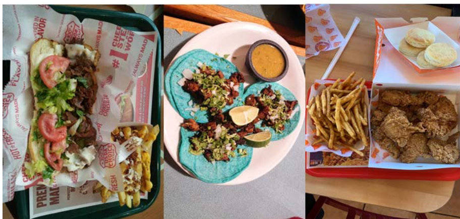
圖四：賣相不怎麼樣可是非常好吃的美國食物們