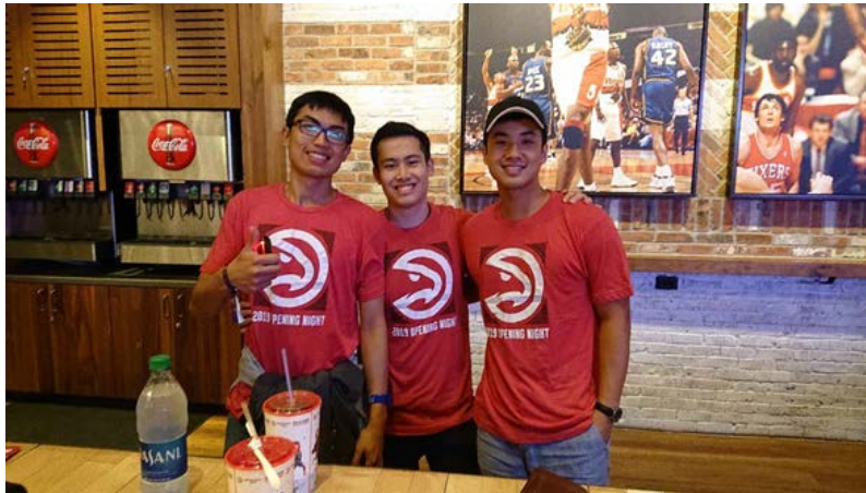
圖九：去亞特蘭大看最喜歡的 NBA！而且是老鷹隊難得的贏球...