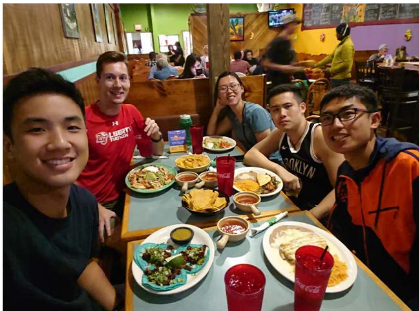
圖七：與當地學生聚餐