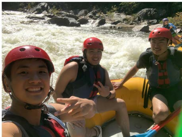
圖五：泛舟天氣非常好溫度剛剛好！