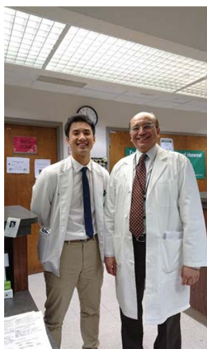
圖一：與當地神內主任合照，他真的是我看過最厲害的神內醫師