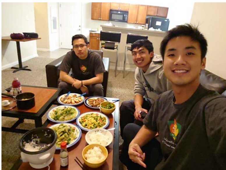
圖十：宿舍的最後一晚，自己煮的最後晚餐，亞洲人就是要煮飯啊