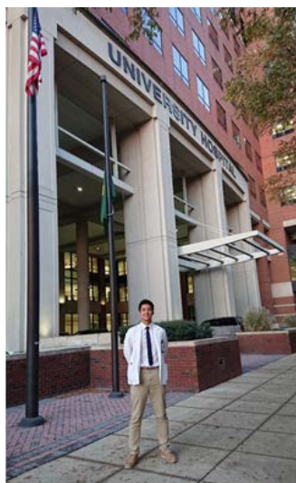
圖二：實習最後一天在其中一個醫學大樓前獨照，UAB 是美國第三大規模的醫院，醫院非常大一開始常常迷路