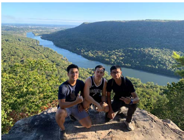
圖六：爬山風景一流