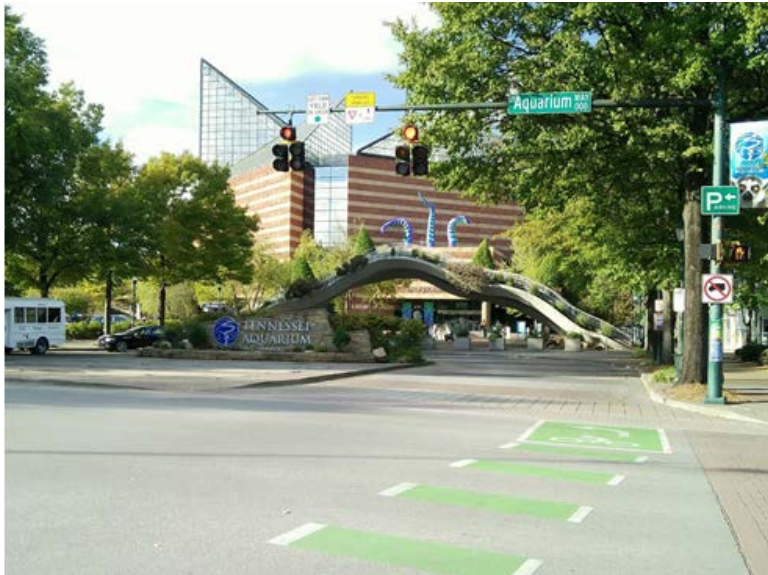
圖八：臨時決定的水族館行程，可以摸水裡的魚非常酷