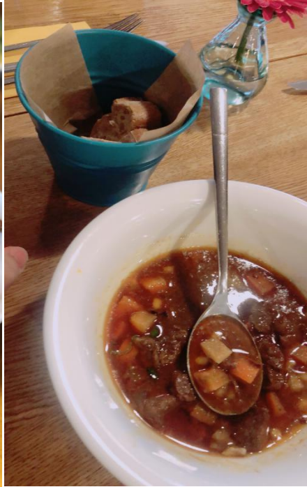
• 維也納著名的 炸豬排以及東歐 常見的牛肉湯