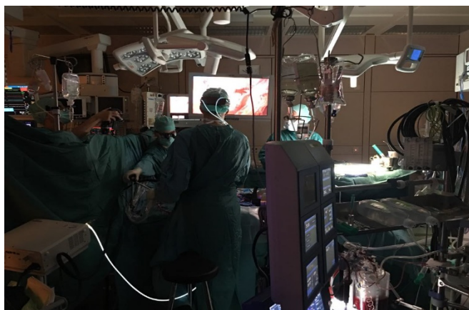
◆ 圖為顯微二尖瓣置換手術，醫生邊動手術邊教導我們醫學生手術流程及相關知識

當然，來外科最重要的便是進刀房了，由於醫院非常大的緣故，花了好一陣子四處詢問才成功抵達心外手術室，這兩周的時間有大約 3/4 的時間在開刀房中度過。這些手術中最令我印象深刻的是心移植以及顯微二尖瓣置換手術，之所以深刻的原因是心移植很少見，另外的二尖瓣置換則是驚訝於 microsurgery 的成熟度，醫師不疾不徐的開刀，不吝於和我講解手術的流程方法。讓我受寵若驚。這兩周打開了新思維，勇於表達自己的看法及積極學習十分重要。