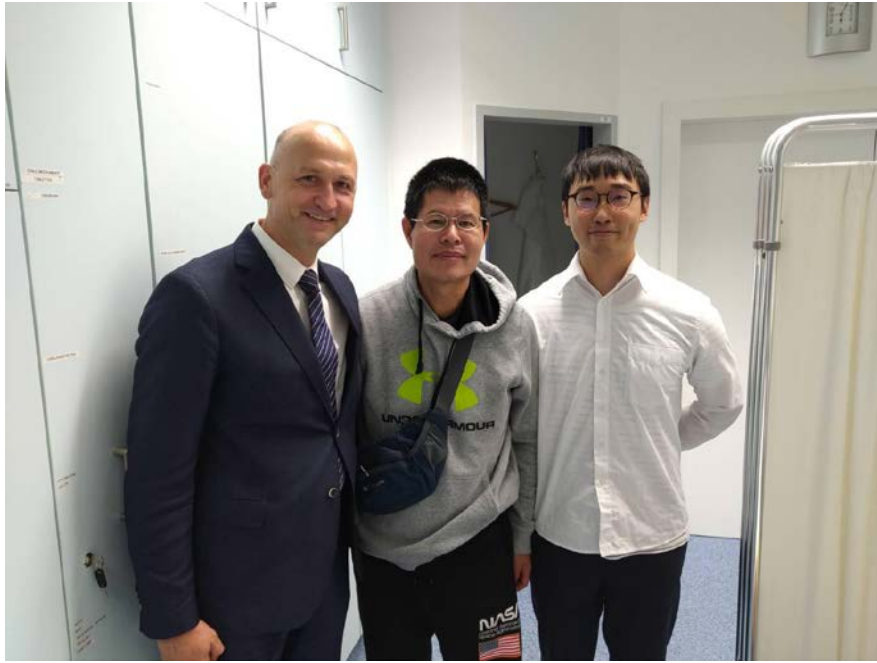
◆ 跟診時，充當主任門診翻譯官，結束後合影留念