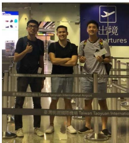
圖八：在桃園機場要出發時的合影