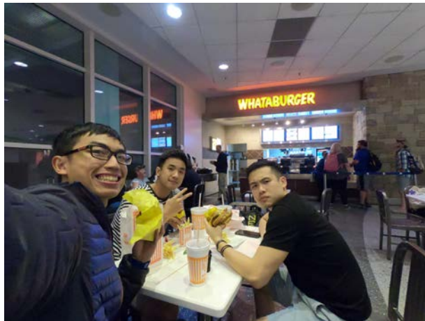
圖七: 在休士頓機場半夜等轉 機，飢餓八小時後的第一餐