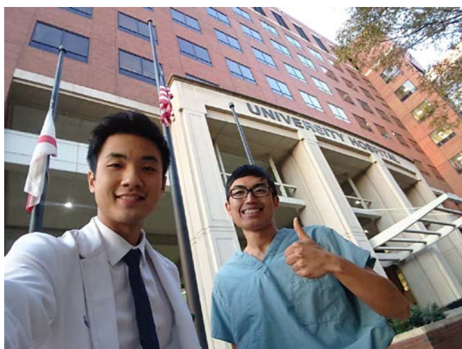
圖十：離院前與同伴在醫院前合照