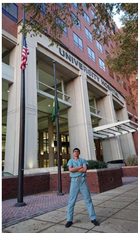
圖九：離院前跟醫院的合照