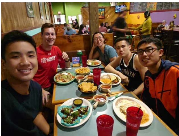
圖四：健行後與大家一同去墨西哥餐廳聚餐