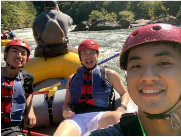
圖五: Ocoee river泛舟活動