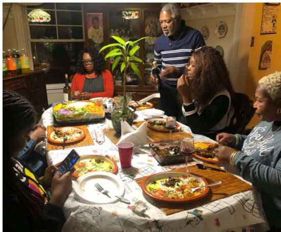
Enjoying Thanksgiving Dinner

托同學的福，也有機會認識一群在美國唸書、工作的台灣人，看到每個人為夢想打拼的容貌，深深感受到俗稱的美國夢不是喊假的，這裡一切人人平等，不分階級與輩份，只要肯努力，機會自然降臨，不愧是當今各國人才薈萃之地，也是文化的大熔爐。或許也是因為在移民人口眾多的東北地區，我幾乎感受不到任何歧視，醫院裡大家都是一視同仁，僅僅兩個月的實習就遇見來自義大利、中國、印度、英國、菲律賓、馬拉威等地的工作夥伴，常常一個醫療團隊查房就像是出動小型聯合國部隊，更晃論看診病患的國籍多元性，從南美、亞洲、中東到歐非無一不缺，院內口譯員的重要性可見一斑。在聽聞眾多醫師及朋友的留美或移民分享後，深深覺得就是美國的多元、包容、與平等，讓所有的不可能都有機會成為可能，才如此吸引著世界各地懷抱夢想的人們，努力跨越語言隔閡、前仆後繼地前來開創新的人生。