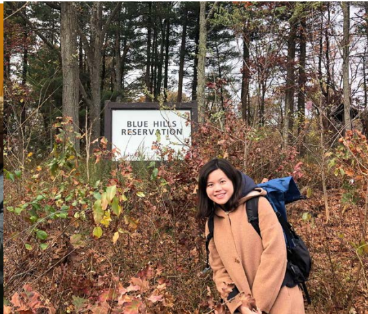
Hiking in Blue Hills