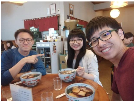
(圖為三人一起吃當地的蕎麥麵)

除了醫學知識的學習在休假的時候也跑去各地觀光像是琦玉縣的川越小江戶，日光東照宮，體驗了各種傳統的日本美食像是拉麵鰻魚飯也參觀了許多歷史古蹟更加了解日本的歷史以及文化，也有去淺草第一次體驗穿和服，還有去港都橫濱體驗自己做杯麵，去箱根的雕刻之森美術館及蘆之湖搭船，我們也跑去各地的瞭望台觀賞東京的夜景，雖然並不是第一次來日本觀光，但是跟著朋友們一起去旅行會感到更加地快樂，他們兩位真的幫了我很多的忙，東京真的是個很有趣的地方，保留有傳統文化也有各式各樣的流行文化，充滿著各種新鮮的事物等待我們去發掘，日本真的是一個很有趣的地方。