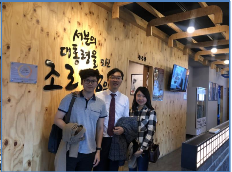
與直屬教授的聚餐