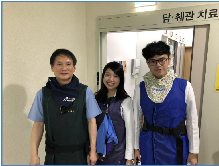
有幸觀摩院長進行內視鏡逆行性膽胰管攝影術