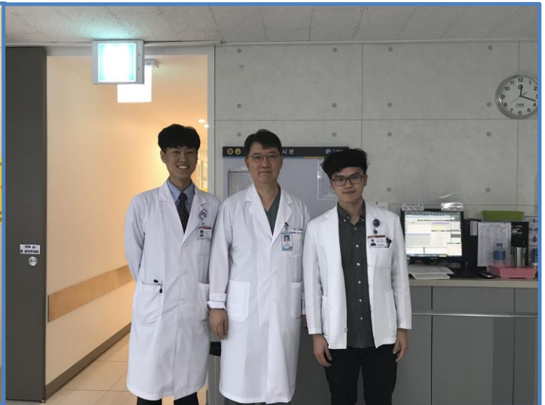
到 GOO 醫院大腸直腸外科實習