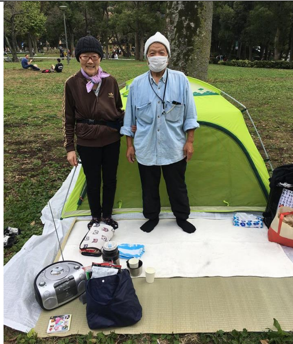
超級親切的舍監爺爺奶奶，在新宿中央公園野餐