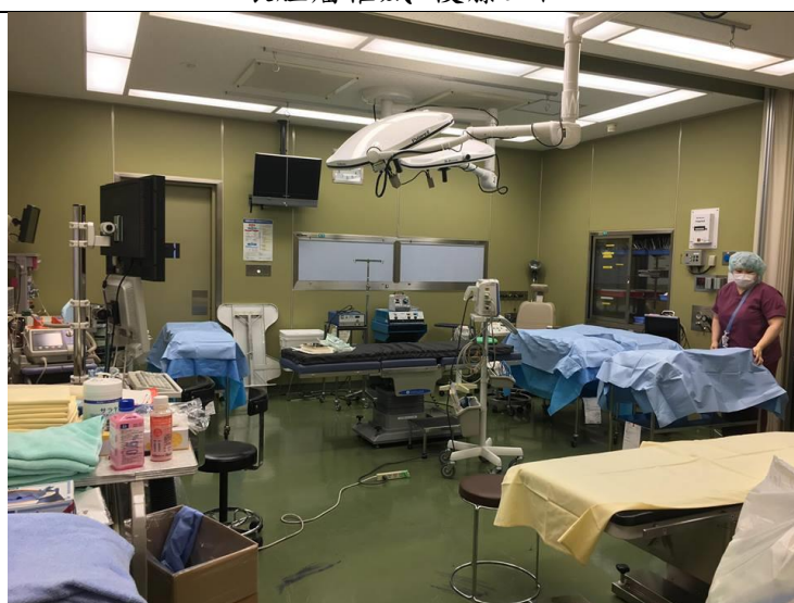
東京醫科大學醫院開刀房