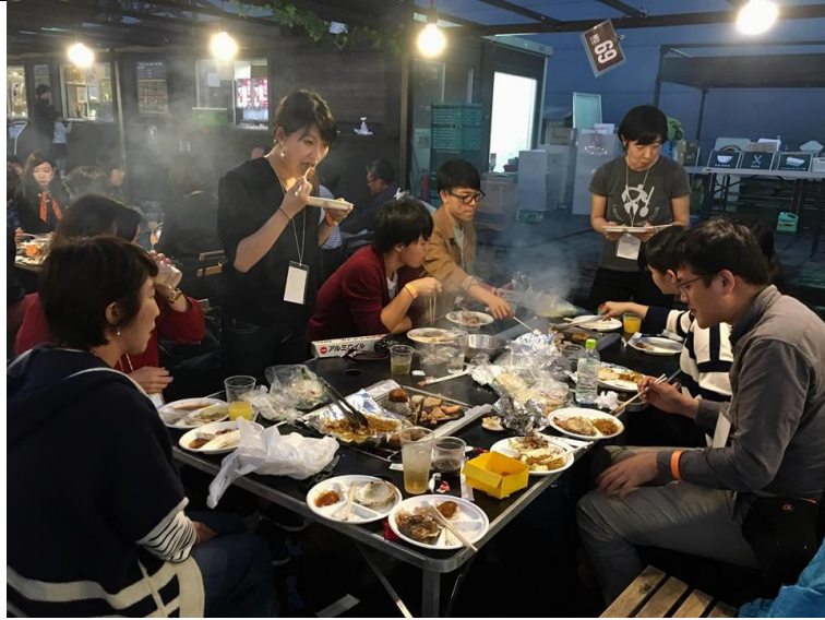
於台場舉辦的交換學生烤肉活動